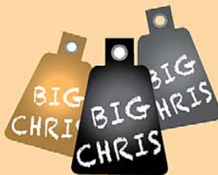
Cartellini con borchia