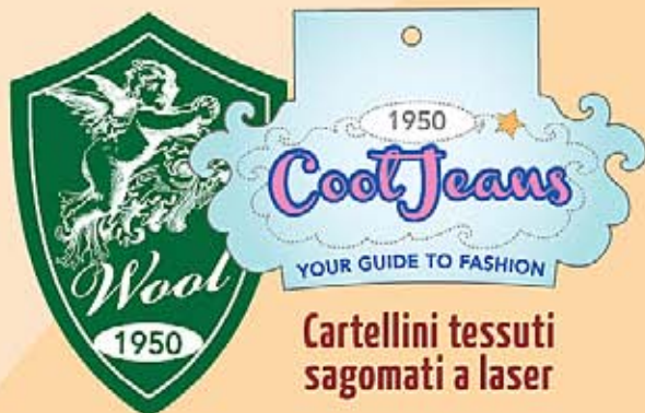
Cartellini tessuti sagomati a laser