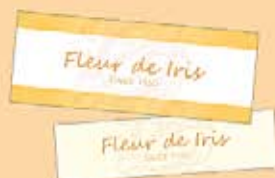
Etichette stampate in genere