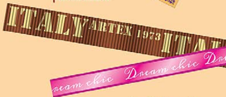
Nastri stampati in serigrafia