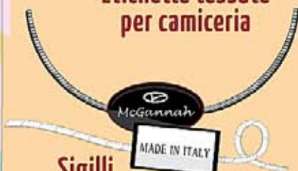
Sigilli di sicurezza