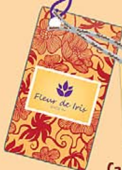
Cartellini infilati con nastri personalizzati